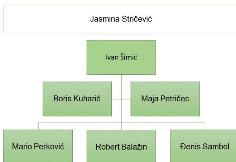
Shema projektnog tima

Jasmina Stričević, pročelnica upravnog odjela za financije i poticanje poduzetništva u Gradu – u radu projektnog tima zauzet će poziciju kontrole odnosno nadzora uspostave Fonda i usklađivanja s internim funkcioniranjem sustava Grada.